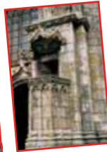
■ Die äußere Kanzel aus dem 15. Jahrhundert, rechts vom Westtor ■