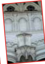
■ Das sogenannte Taufbeckenportal im Süden aus dem 15. Jahrhundert, wo die ersten Renaissance-Verzierungen entstanden ■