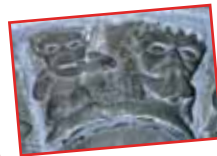
■ Die romanischen Säulen des Mittelschiffs, die von Kapitellen mit pflanzlichen oder historischen Motiven überragt werden. (Die Märtyrer von Saint-Etienne, Daniel in der Löwengruff...) ■