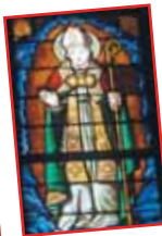
■ Die Glasmalereien ■