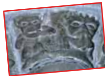
■ Los pilares romanos de la nave central coronados con capiteles de motivos vegetales o históricos (Mártires de San Esteban, Daniel en la fosa de los leones) ■

...Apenas terminadas estas enormes obras, la colegiata entra en la tormenta revolucionaria. No sufrió grandes daños, aparte de las vidrieras. No obstante, la Revolución conllevaría importantes modificaciones estructurales dado que, en 1792, se suprime el estatus de colegiata y los canónigos se exilian a España.