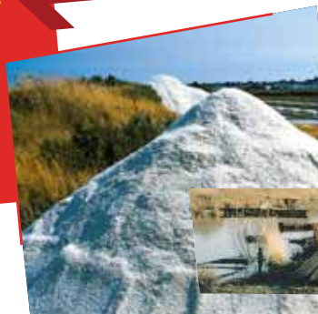
■ la Comarca Blanca, la de la sal y las salinas; la Comarca Negra, la de la turba y del Parque Natural Regional de Brière ■