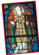
■ Las vidrieras ■