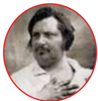
■ Tras los pasos de Balzac ■