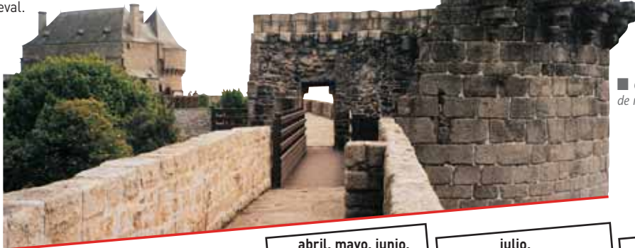
■ Camino de ronda ■

le abre parte del camino de ronda de los 1434 m de la excepcional muralla medieval.