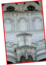
■ El porche "del Baptisterio" en el sur, construido en el siglo XV y donde aparecen los primeros decorados del Renacimiento ■