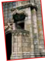
■ El púlpito exterior, del siglo XV, a la derecha del pórtico occidental ■