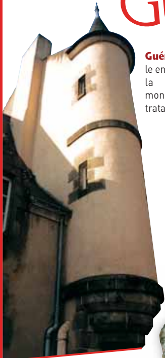
■ Hospital Saint-Jean ■